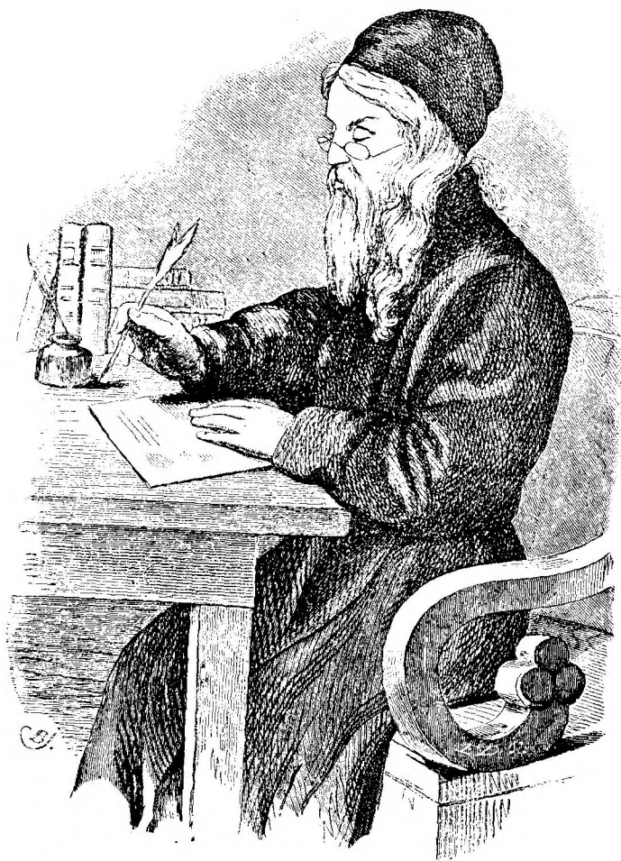
Просвѣтитель Алтая Архимандритъ Макарій.