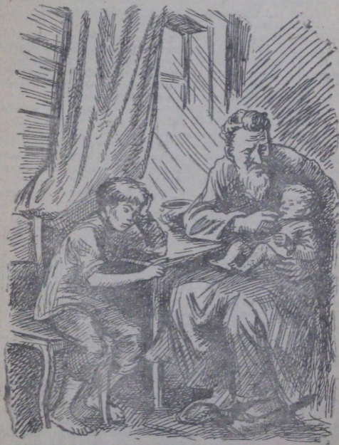
Таадам баланы тизезкине отургызала, бойы азырады.