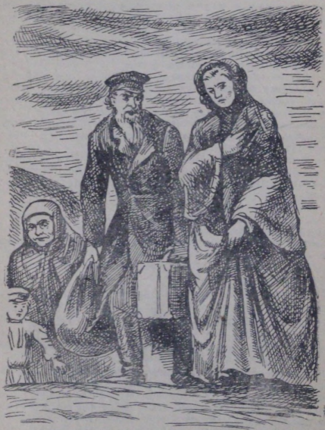
Таздам энемле кожо опчозыныг алында барып жаттылар.