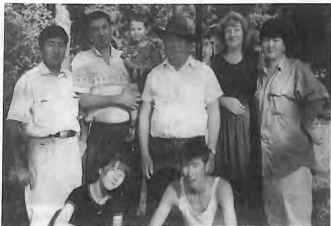
2003 ј. А. О. Адаров билезиле кожо.