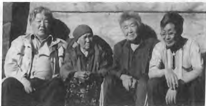
2003 јыл, јаан изү ай. А. Адаров, Байда эјези, Байкал ла Борис ийнилери.