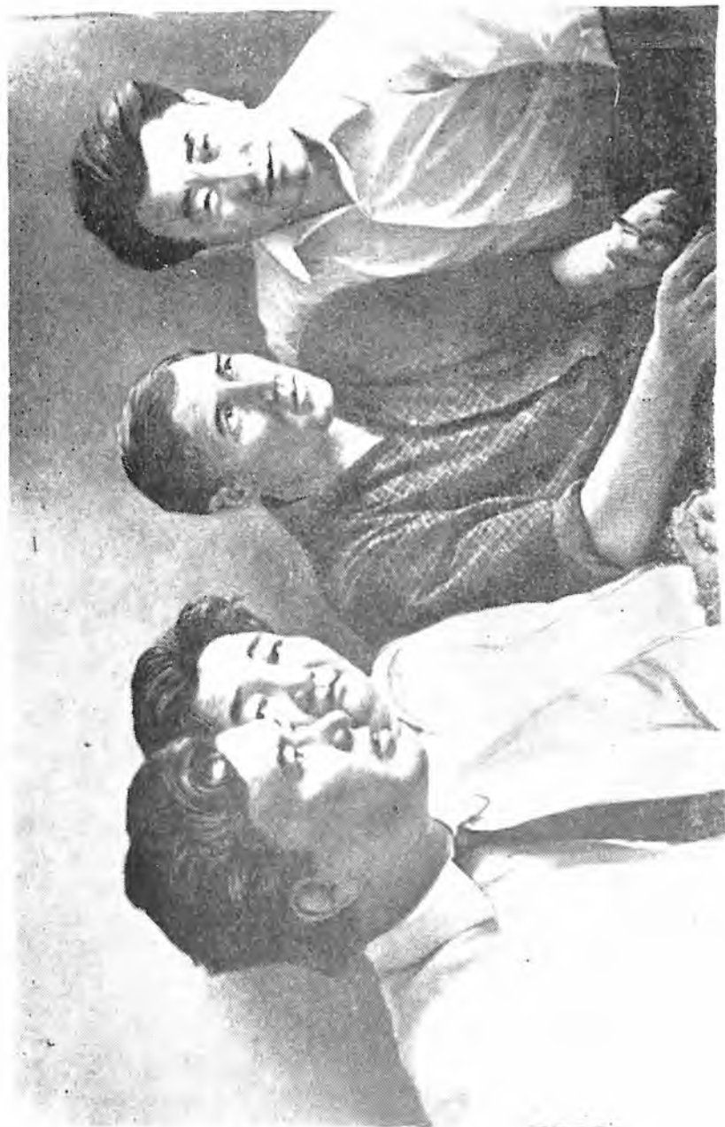
— 46 — Арапчи Атап иб. Суяк Мейт Нуркири. 1971 јули.