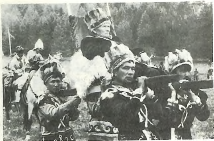
А. Г. Калкинди албаты көдүрүп жат. Жабаган, 1995.

Эл-ойында эн чыйрак ла талдама ээр jepceлдү үч атты Шеба-лин, Кан-Оозы ла Улаган аймактар сыйлагандар. Ол алтай албатынын jебреннен бери кайчыларга беретен эн бийик, тоомjылу жанжыгузы.