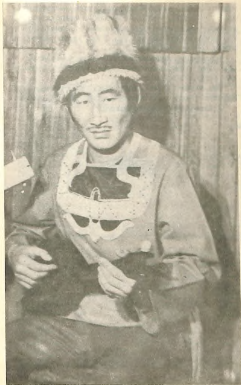
Кайчы Элбек Калкин. 1977, Москва.