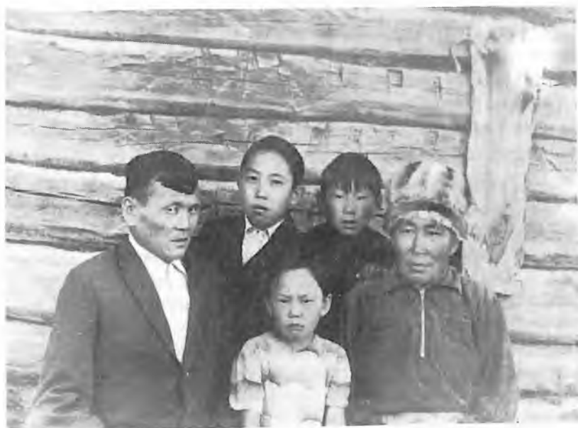
Алексей Григорьевич ле Евлокия Яковлевна Калкинлер балдарыла кожо.

бу бйдө ол Кан-Оозы аймактын ончо журттарын эбирип, улустын сурагы аайынча айылдарда ла клубтарда кайлап жүрген.