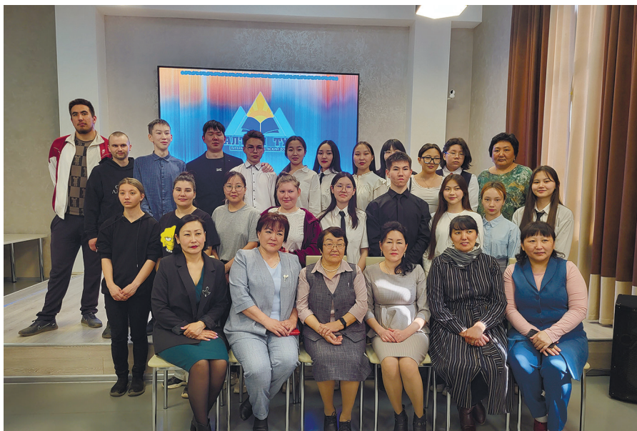
На презентации книг издательства «Алтын Туу»