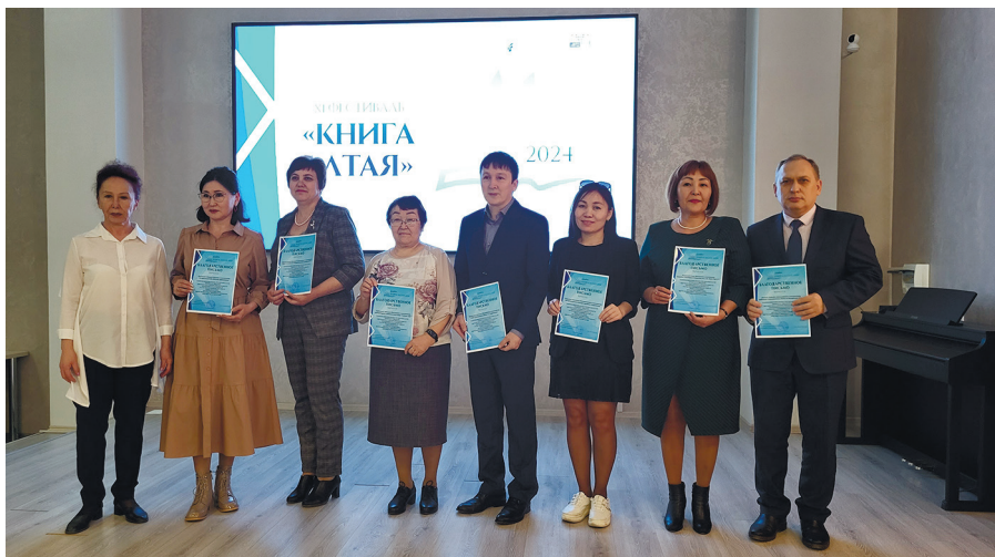
Партнеры Национальной библиотеки имени М. В. Чевалкова на Фестивале «Книга Алтая»