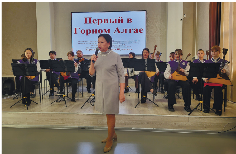
Вечер памяти композитора Б. Шульгина в НБ РА