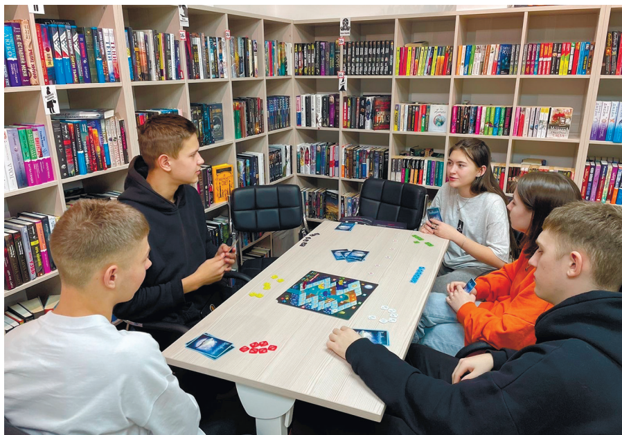
Турочакская ЦБ им. В.М. Башунова. День настольных игр