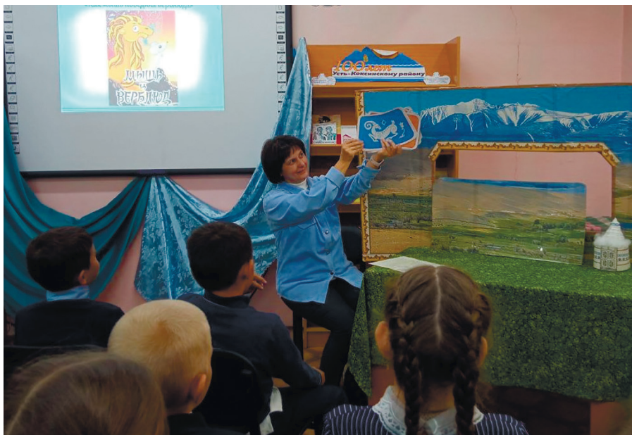
Усть-Коксинская ЦБ. Час краеведения «Самый счастливый год»