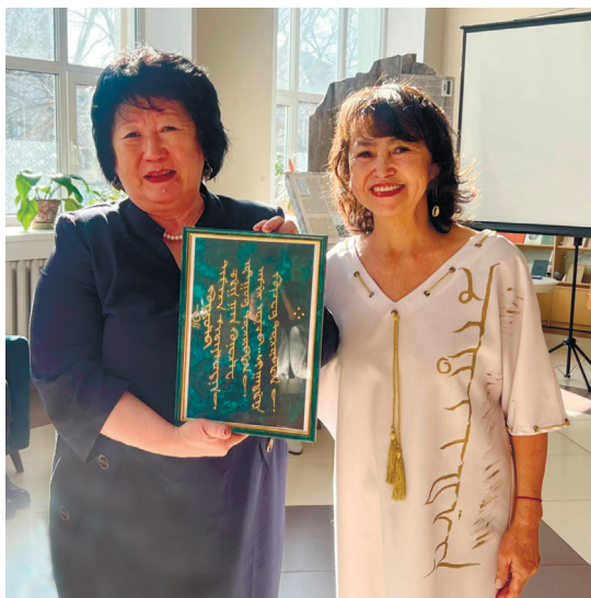
НБ РА. День алтайской письменности «Тодо бичик»