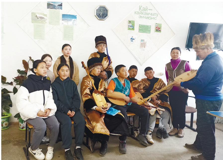
Кокоринская библиотека-филиал. Встреча с топшууристом