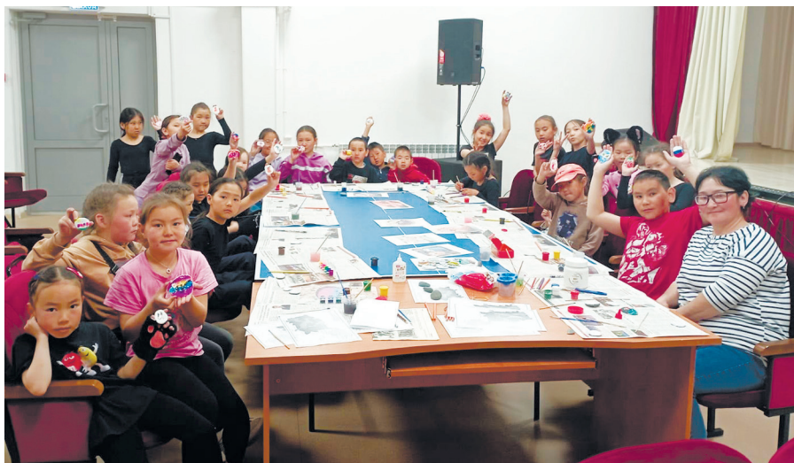
Бельтирская библиотека-филиал. Краеведческая работа с юными читателями