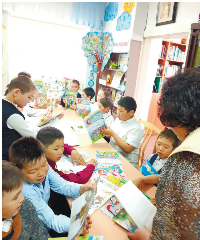
Шибинская библиотека-филиал. Творческий час «Соотожьт, ойнойлык!»