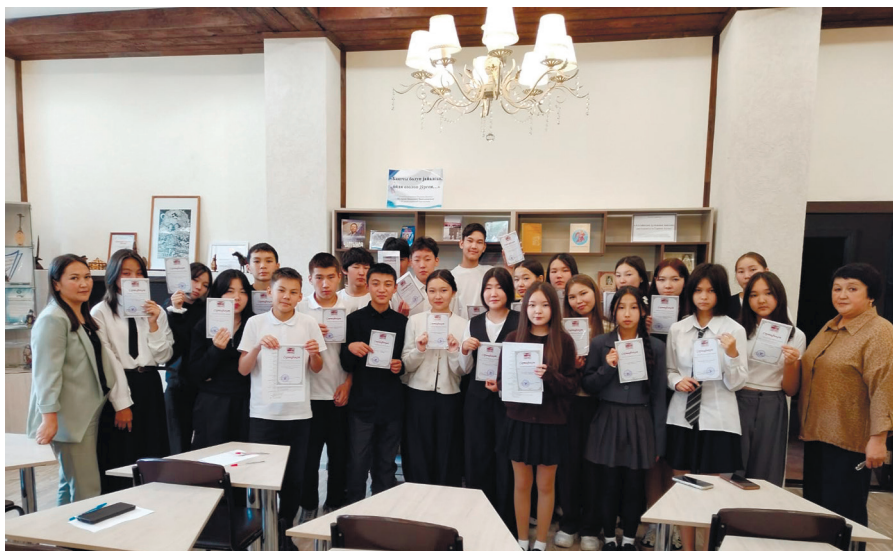
НБ РА. Краеведческий диктант, посвященный М.В. Чевалкову