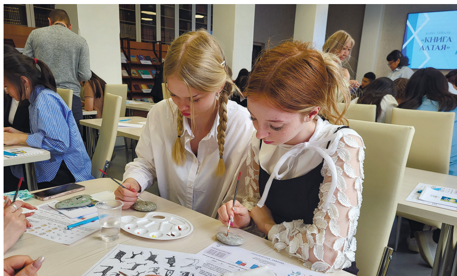
НБ РА. Рисуем петроглифы