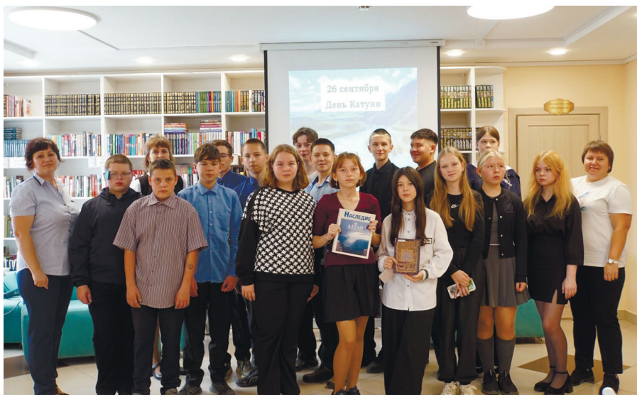
Чойская ЦБ. День Катуня, 2025 г.