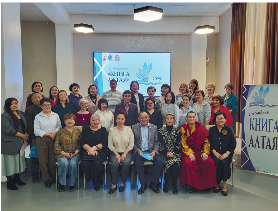
НБ РА Книга Алтая 2025 г.