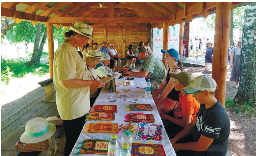
Сотрудники Национальной библиотеки имени М. В. Чевалкова на Родниках Алтая 2025 г.