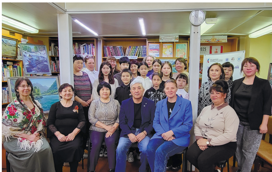
Проект «Катунь – от истока до устьев» в Узнезинской библиотеке