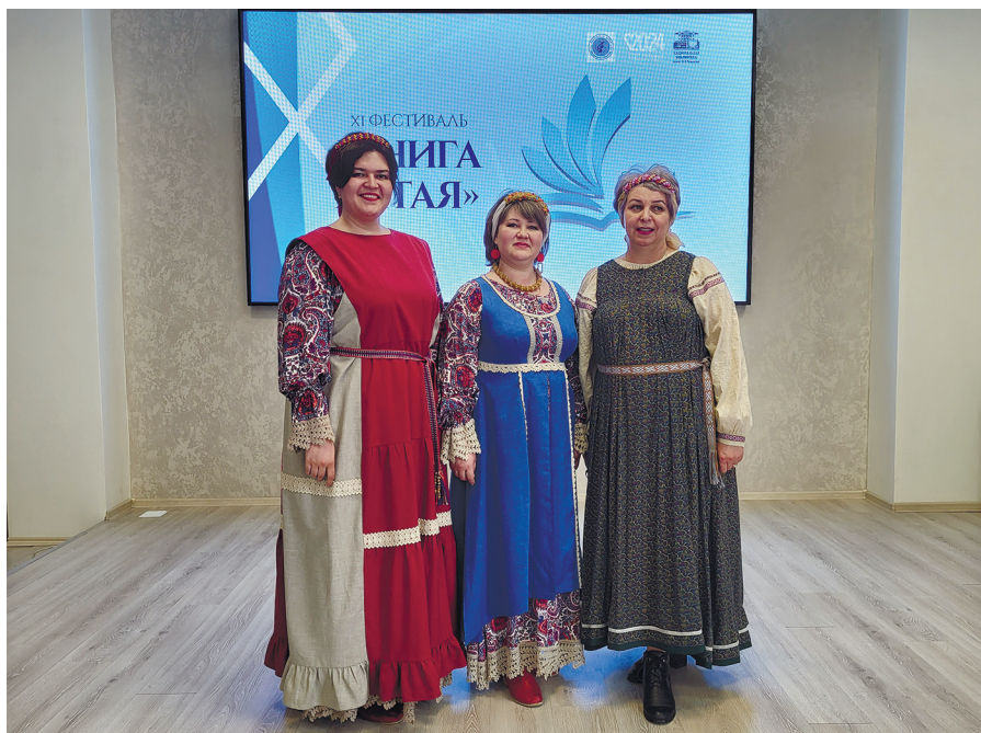
Презентация Усть-Коксинской МЦБС в НБ РА