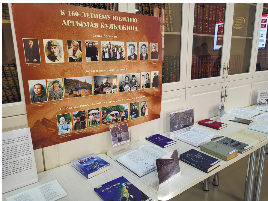
Выставка к вечеру памяти Аргымаев Кульджина