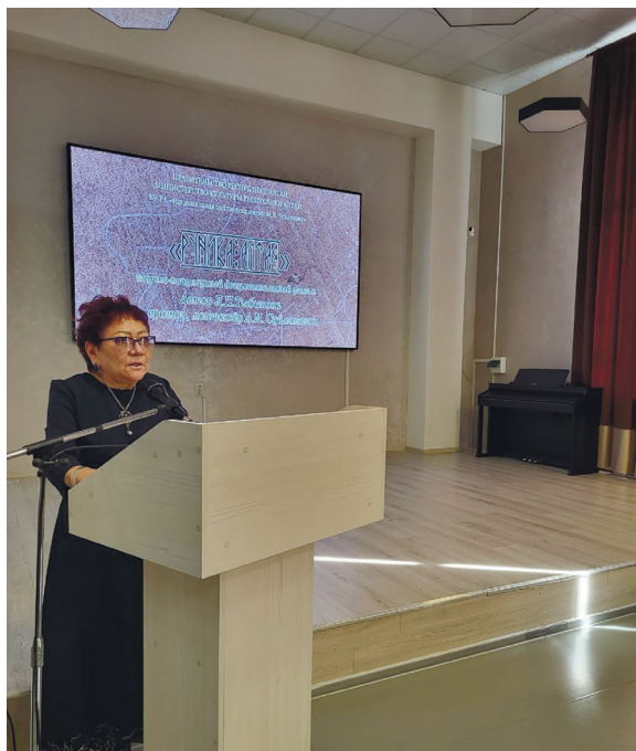
НБ РА. Презентация фильма «Руника Алтая»