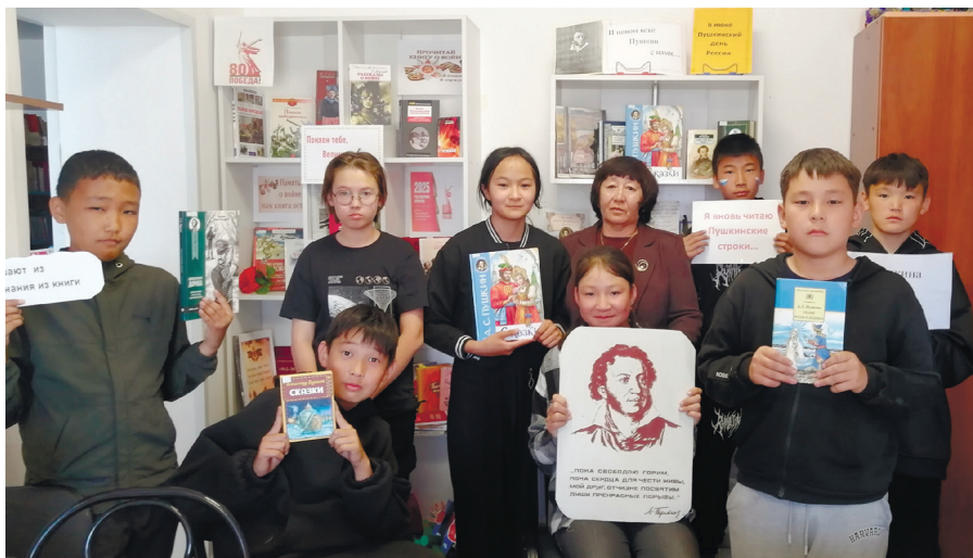
Теленгит-Сортогойская библиотека-филиал «Я вновь читаю пушкинские строки»