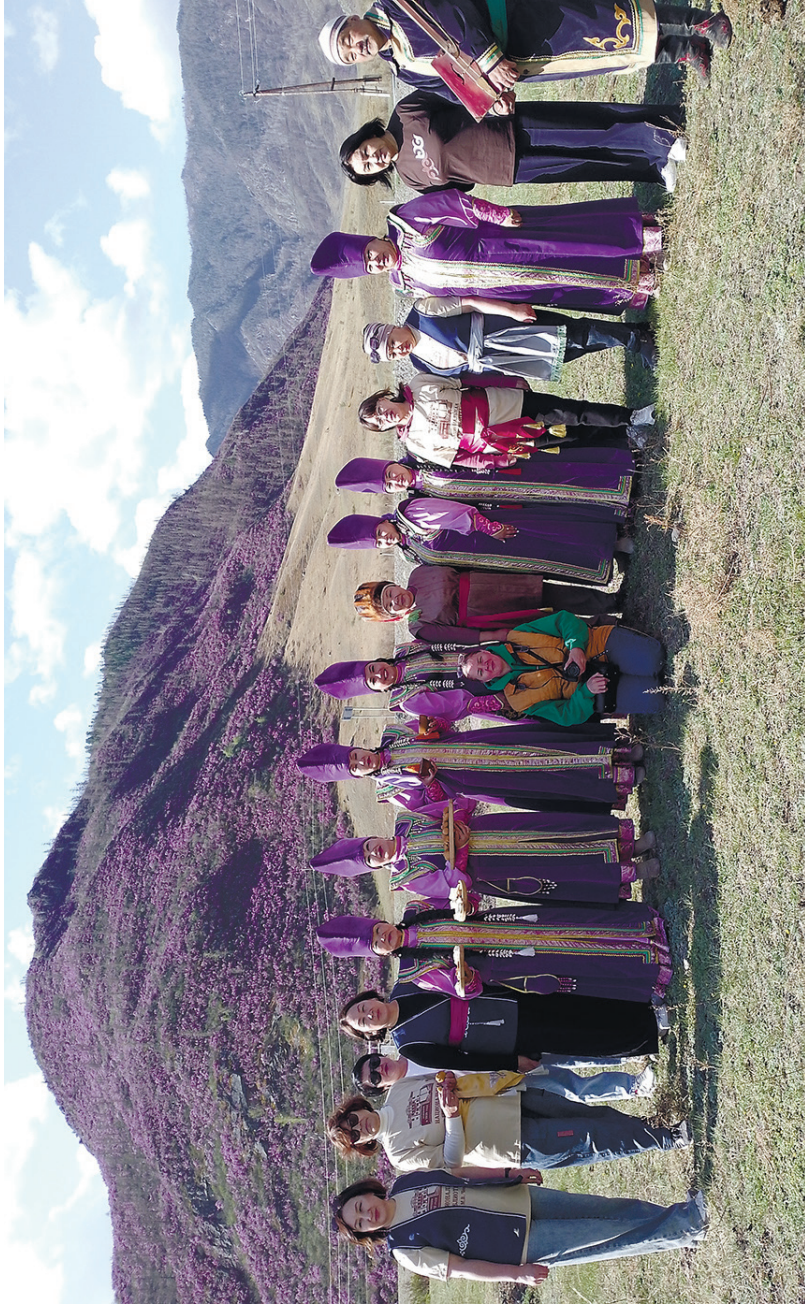
Этнопроект «Катунь – от истоков до устья»