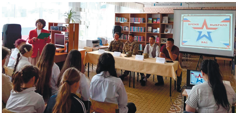
Шебалинская РМБ. Патриотический час «Время выбрало нас»