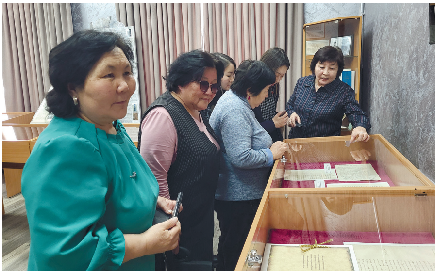
В музее «Книга Алтая» Национальной библиотеки имени М.В. Чевалкова