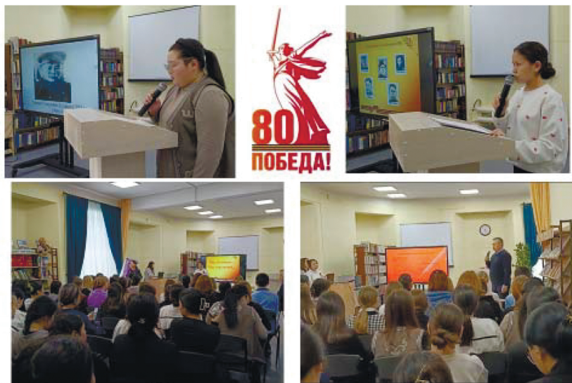
Республиканская детская библиотека совместно со студентами Горно-Алтайского педагогического колледжа им. В.А. Славенкина провели час памяти «Герои Великой Отечественной войны, призванные Усть-Канским РВК».