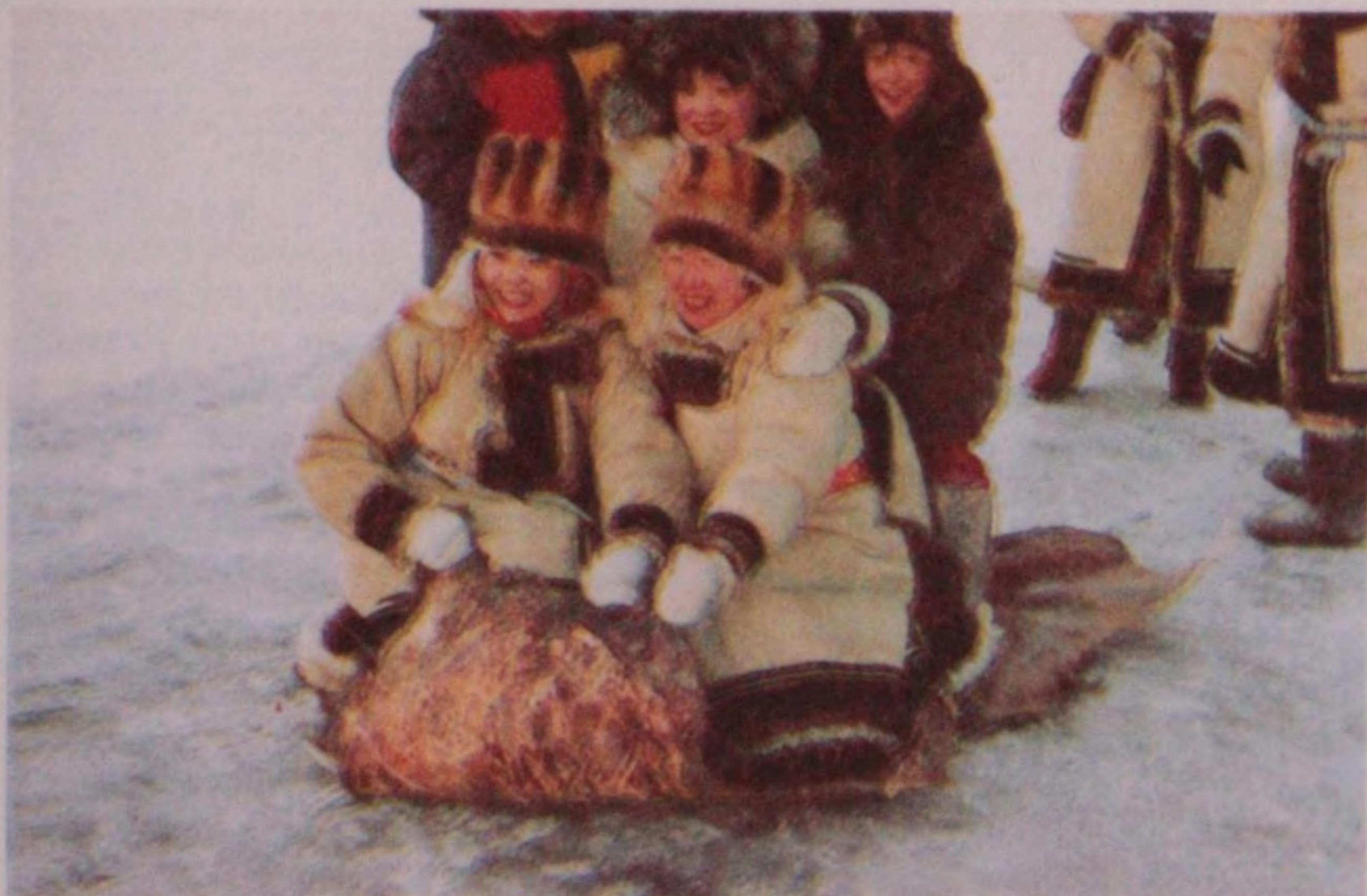
Тошло тоньрган тонди төмөн тереге отурып, жынылаар көрү-маргаан. Мөндүр-Соккон, Кой жыл.