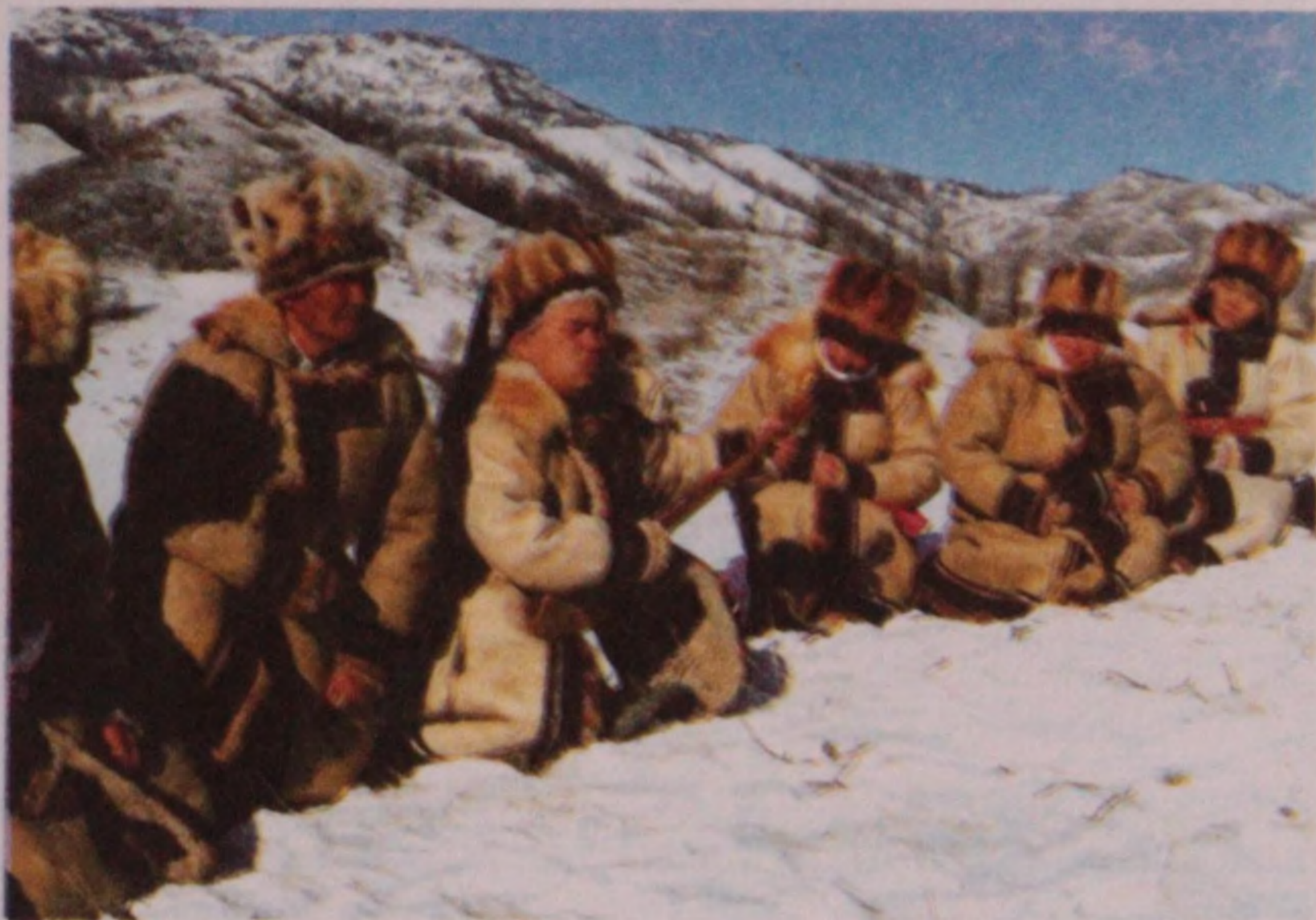
Чага байрамды алкаганы. Кайчы А. Көзөрөков. Мөндүр-Соккон, 2003 ж.