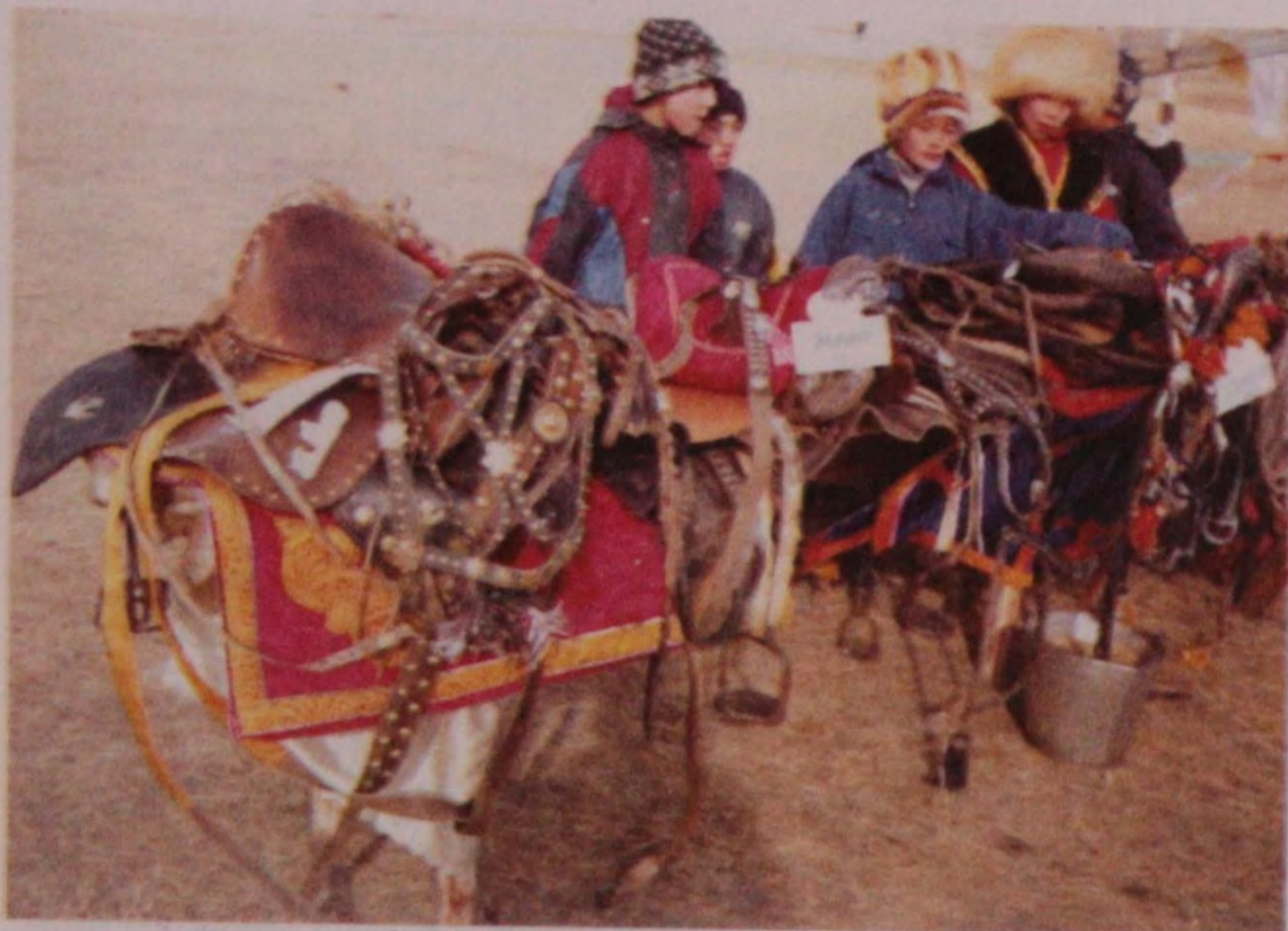
«Эрјине малдын ээр-јепсели». Кырлык 2002 ј.