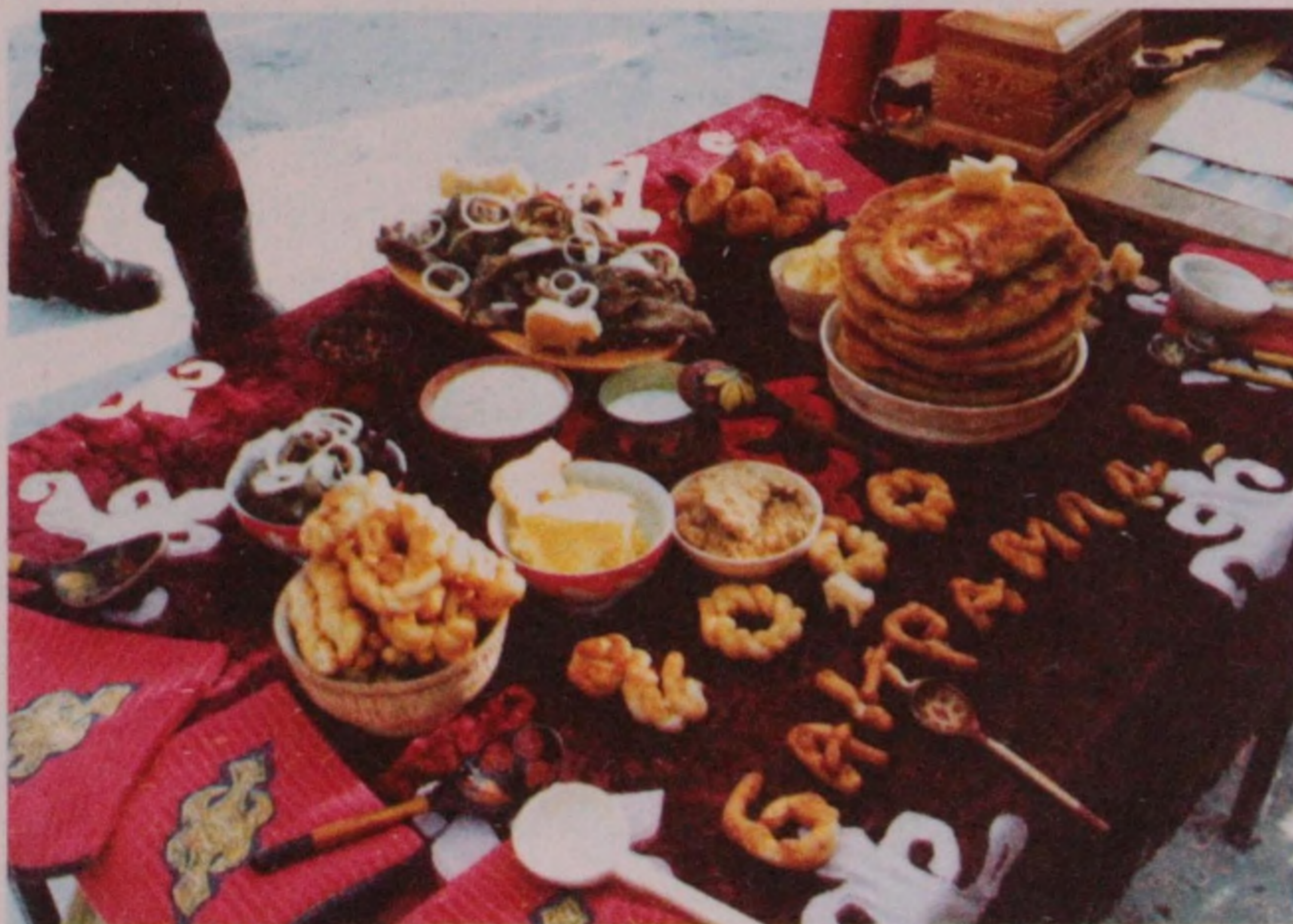
Тастарканнын көрүзи. Кан-Оозы, 2000 жыл.