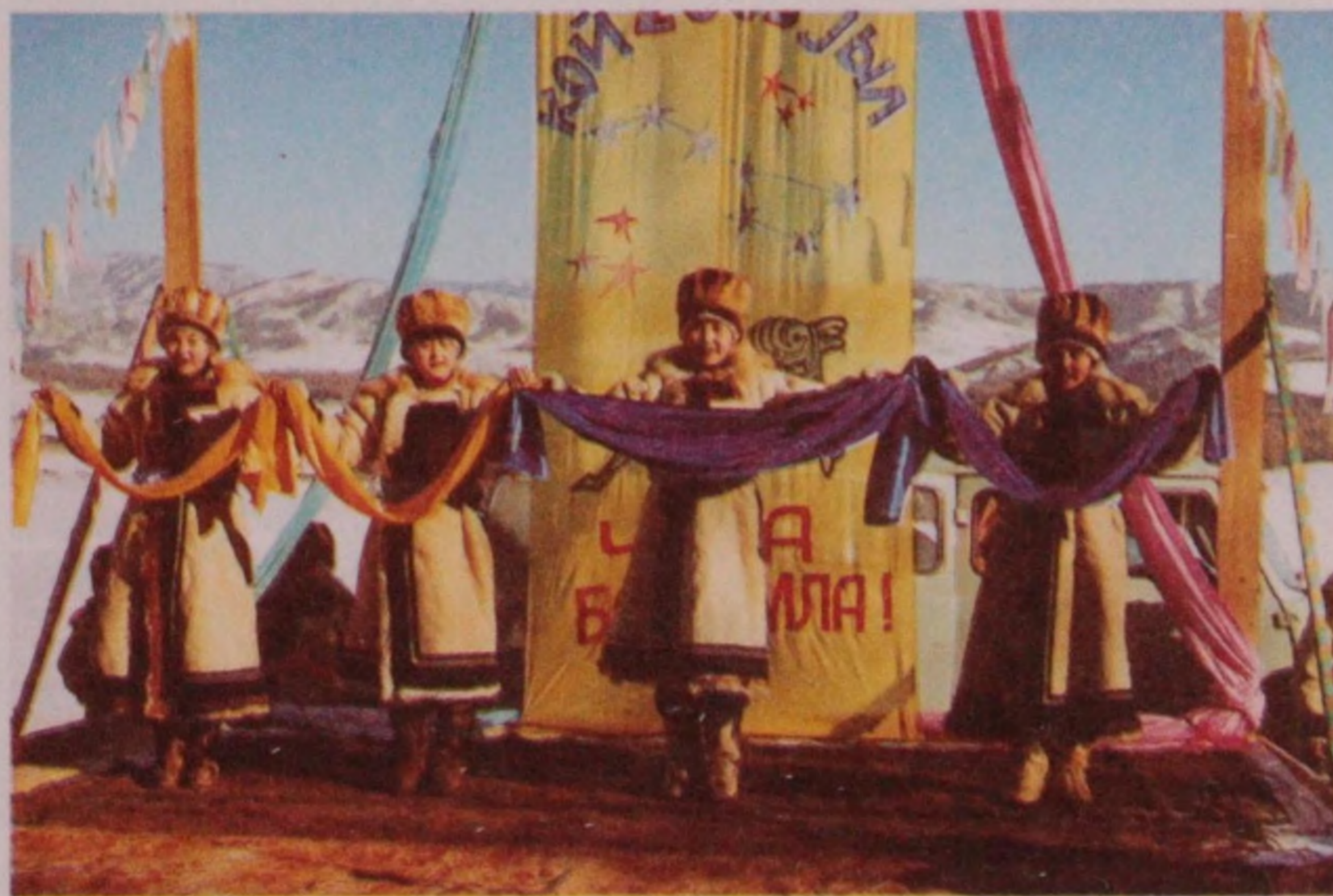
Көзүл јурттын бијелик өмөлиги «Күзүни» алтай курга учурлалган бије көргүзет. МөндүрСоккон, 2003 жыл.