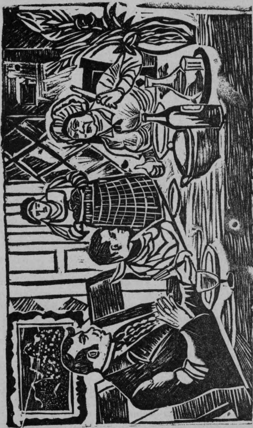
Pavlika ajdarb çok çarış kadıbt alğan.