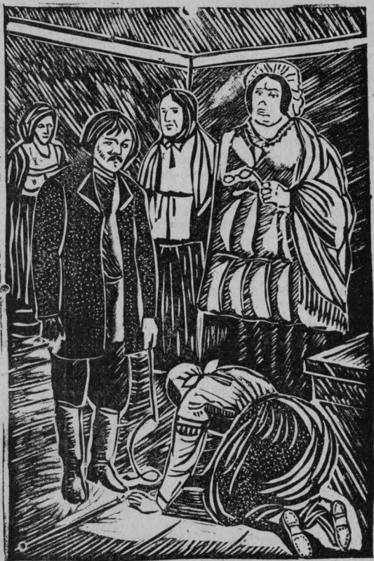
Үреткен учун sposibo volън.