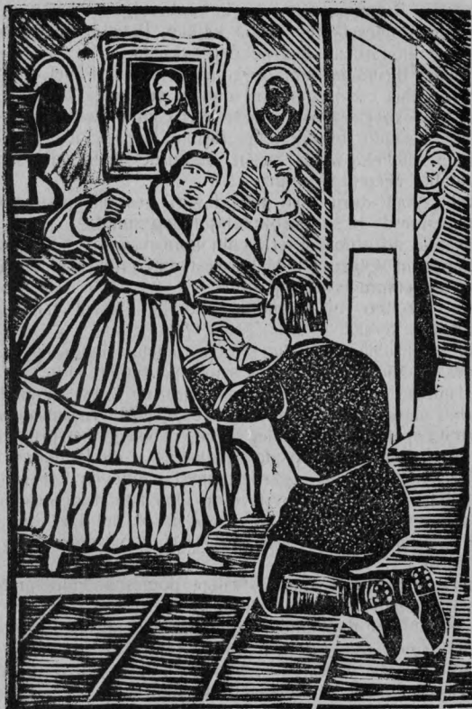
Bisti bozot  r ken