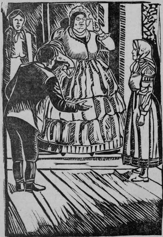
Mailinovska albala ekelgeni.