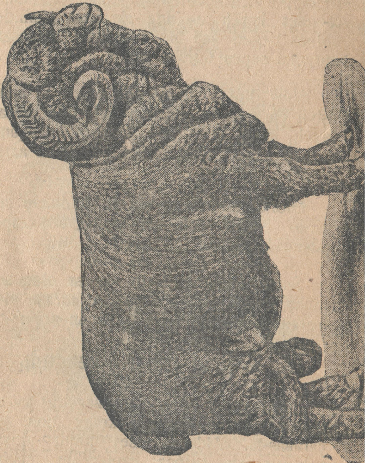
Voloŝskij uktu kuca.