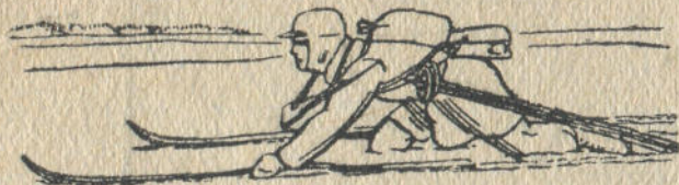
7-чи дьур. Тёрттамандап дьылары.