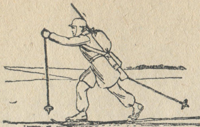
2-чи дьур. Элип-селип базыт—базарын сол буттан баштаган.

ёткюрөдилер. Чаначыларды дьуучыл действовать эдерине юреткедий примерлерди история ас билер эмес. Озогы чаначыл орус черю героический походтор эдип туратандар. Орус черюлер, чананын болужыла, Югорский дьерди XV чактын учында дьуулап алгандар.