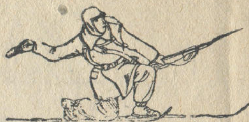
12-чи дьур. Гранатты тизе бажынан таштаары.

Ичкеери сайары. Ёштю (кептюр) сол дьанында турган болзо, кажы бир бутты алтаган аяс, онын мылтыгын сол дьаны дьаар чарчада согор, база бир бутты алтаар тушта оны саяр.