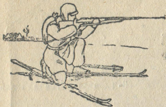
9-чы дьур. Тизе бажынан адары.