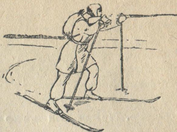
10-чы дьур. Бут бажынан адары