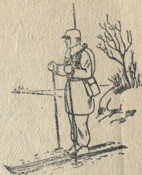
1-кы дьур. Чаналу чике турары.