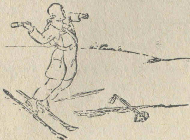
13-чи дьур. Дьаткан кижы, тура дьюгюреле гранатты таштаары

Чедендер ажарында, оны алтай база да берери бар, оны ёрё чыгала да ажары бар. Чеденди ажыра база беретендерин ол бийик эмес болзо эдетен. Он дьанын чеденге дьёлёй туруп алар. Сол таякка таянып, бюктеген он будыла он чананы кёдюрер, ол ок ёйдё, оны он таякла кожо чеденди ажырала, чеденнин биринчи, экинчи агажына базып алар. Он таякка таянып, бюктеген сол будыла сол чананы кёдюрер, ол ок ёйдё, оны сол таякла кожо чеденди ажырала, он чанага коштой базар.