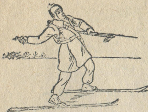
11-чи дьур. Гранатты бут бажынан таштаары