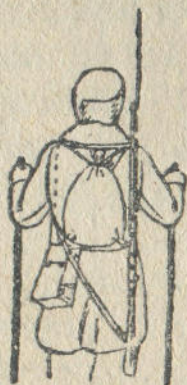
4-чи дьур. Мылтыкты поход тужунда дьюктенери

Чаналу элип-селип, эмезе дьаныс уула базарынын (2-чи ле 3-чи дьур.) таркадылган эп-сюмезин бу брошюрада бичибей турубис. Базыштын мындый бюдююзин бичигенин, анылу руководстволордон ло брошюралардан таап аларга кем дьок.