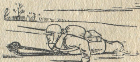
6-чы дьур. Кёнкёрё дьадала дьылары