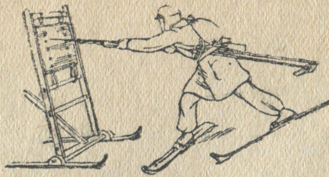
14-чи дьур. Дьыдабыла он дьаны дьаар саяры.

Бийиги 50-нөн 120 см. дьетири чеденди, оны ёрө чыгала ажып дьат. Сол дьанын чеденге дьёлөй туруп алар. Он таякты чеденди ажыра салала, оны чеденге куустыра кайра эдер, он колыбыла чеденнин юстинен тудунар, сол колыбыла десе сол таякка таянар. Сол таякка ла чеденге таянып, ёрө секирип чыгала чеденге отурып алар. Он колыбыла тудунганын ёскөртө тудала, кёксин он дьаны дьаар эбирткен аяс, тизезинен бюктелип калган он бутла чананы кёдюреле, чеденди ажыра салып ийер (15-чи дьур.). Кёдюре бойынын эбирип бараатканын токтотпой, бюктелген сол будыла сол чаназын чеденди тюрген ажыра салала, чеденнен тюзюре калып ийер. Чаначы чеденнин юстине бектеп отурып алза, эки будын чеденнен дьаныс уула да ажырып ийер.