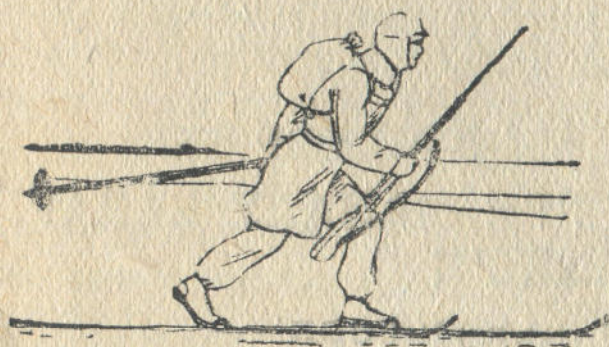
5-чи дьур. Юзюктелтип дьюгюриш.

Чаналарга дьадала. Бу эп-арганы, кары дьука да, кату да дьерге тузаланып дьат. Чаналарды бирюзин-бирюзине коштой дьигин табаштыра салып алар. Таяктарынын учын алын кайыштан (носковой скобанан) ёткюрер, тегеликтерин чаналардын бажына кийдирип алар. Таяктарды чаналардын юстине куустура салып алар. Мылтыкты дьюктенип алар эмезе таяктардын юстине салып алар. Дьыданы таяктын тегеликтеринен ёткюрип алар, чаналар бойы-бойынан айрылышпазын деп, бир чананын кийин буузын база бирюзине артып алар керек. Чаналардын грузовой площадына кёнкёрё дьадып алала, эки колыла темденип дьылар (6-чы дьур.). Дьакшы дьылбай турган болзо, будубыла дье-межер.