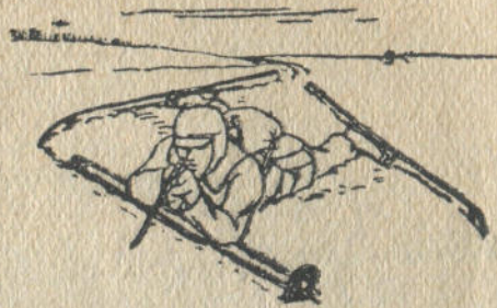
8-чи дьур. Дьадала адары.

Тёрттамандап энмектеери. Бу эп-арганы кары дьаан дьерге тузаланып дьат. Таяктарды тудунып алар эмезе олорды сол дьанынан курга кыстап алар, мылтыкты дьюктюгинен мойынга илип алар эмезе дьюктелип алар. Чаналардын грузовой площадкаларынан туду алар, чаналардын юстине таянып тизеленип туруп алала, элип-селип, бутла болужуп дьыларын баштаар (7-чи дьур.).