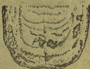
2-ci çuruk: Ystyndegi eegi- niñ tiř çok kьrьndağь, tur- gun oorudьñ walularь.

Erdiniñ ystynde ic çanьndağь, waza tandajьndağь çьlçьrk owolockazь (çuka terezi) izy kurgak kyşkьlym øndy wolor. Oozьn askan kijnde çuulup kalgan řilekeji tьřtьla kořtoñ ağьp turar. Oorьgan soon- do 2-4 kynunde erdiniñ-le wyleziniñ ic çan- ьnda, oozьnyñ tiř çok ystygi welyginde, tiliniñ sьrt la kujularьnda waza çaagьnyñ øregi ic çanьnda, çaanь kuzukca onoy emeř çaan kicyly, çaandu torsoktor wolor çat. 1-3 kyniñ wazьnda torsoktorь çazьlьp, olordьñ ordьna suulantьp turar, syreen kьzyl oorunkaj tereç emes walular artьp kalar. Udavaj 2-5 kynde ol walular tuј wudyp, mal çazьlьp øndøne berer.