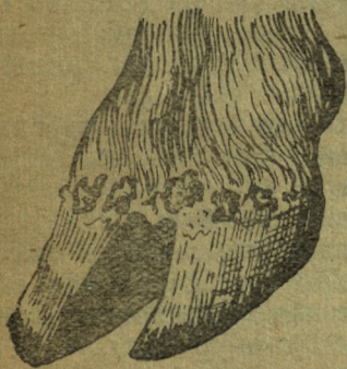
3-ci çuruk: Çoon uј maldьñ ooru tuјgağь.

Tuјgaktьñ ooruzь koř savazь oozь- nyñ iси oorьganь la kozo çanьs øjde wolor çat. Tuјgak ooruzь wařtalganda mal aksap, wazьp wolyoj albadanьp wazьp turar, anca- dala tys emes, katu çerge wazьp wolyoj turar. Tuјgak-la tereniñ tawьřkanь, tuј- gaktьñ ortozy izip, tižip, ønzyrkej wolor, 1-2 kynen tuјgaktьñ ajьzьnda, oogoř torsoktor tawьlьp, kijnde olor çyre çaanap, çerdin kuzugь kreezi wolor. Ol torsoktorь çazьlgan kijnde waza oozьndağьdьj walular wolor. Koly widundağь walularь, oozьndağьzьndьj wasьm çazьlьbas. Tuјgaktьñ (ajьzьna) orto- zьna kirgen wok, walkař, kumak tuјgaktь waza oorьdьp çat. Turgun oorudañ çazьl- za da waza uzak aksap çyurer.