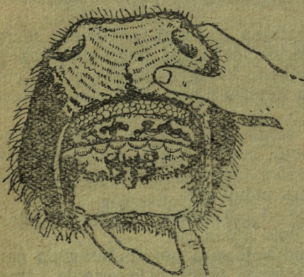
1-кь cурuk: Çoon uь maldьn таң- даьдьndaгь torsokторь-la valularь.

Malga turgun oору vaalu, terezi cара tьmalganьnaң azьra tereziniң kandьj bir soььlgannьnaң oozьnьdь cьl- cьgьk ovolockozьnьdь kemdy cери, ke- zik birde celdiniң-le, tuьgagьnьdь ke- mi azьra cugup çat.