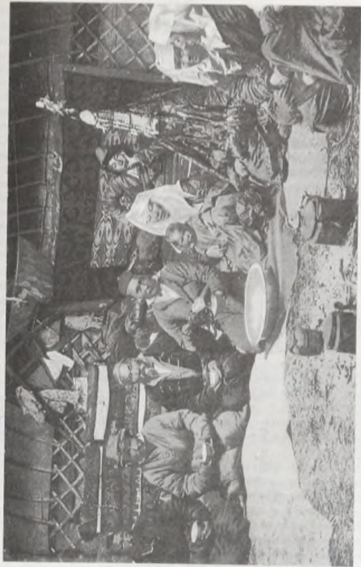
В казахской юрте. Начало XX века.