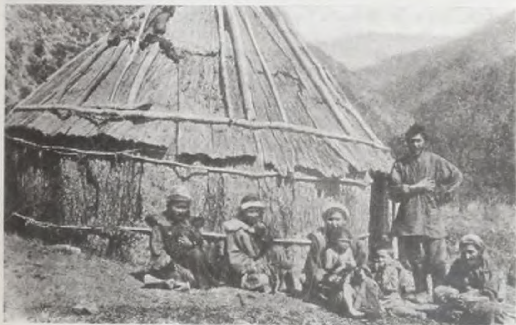
Стойбище алтайских кочевников на реке Ороктой. Фотография начала XX века.