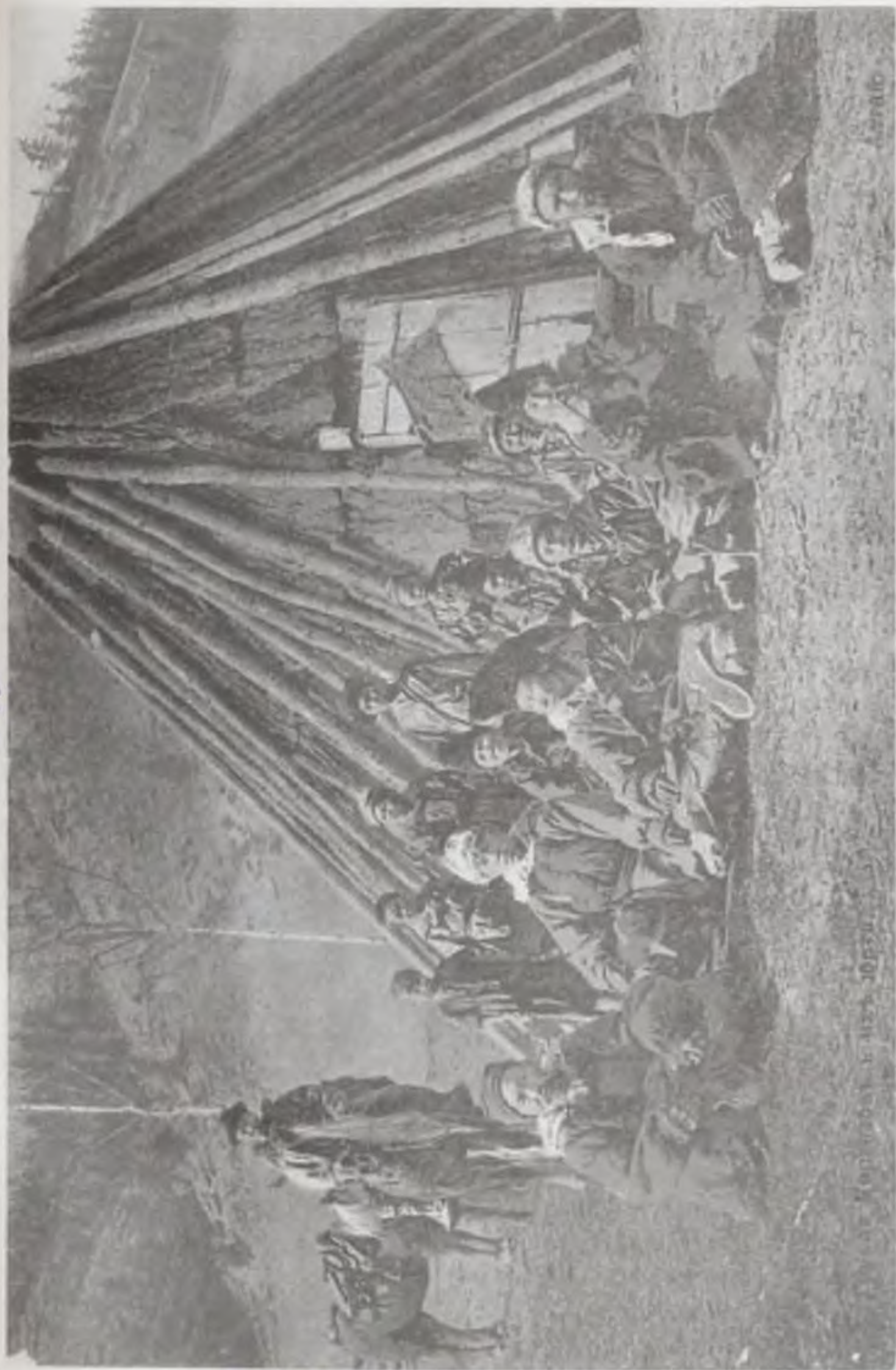
Алтайские кочевники. Копия почтовой открытки, изданной в г. Стокгольме в начале XX века.