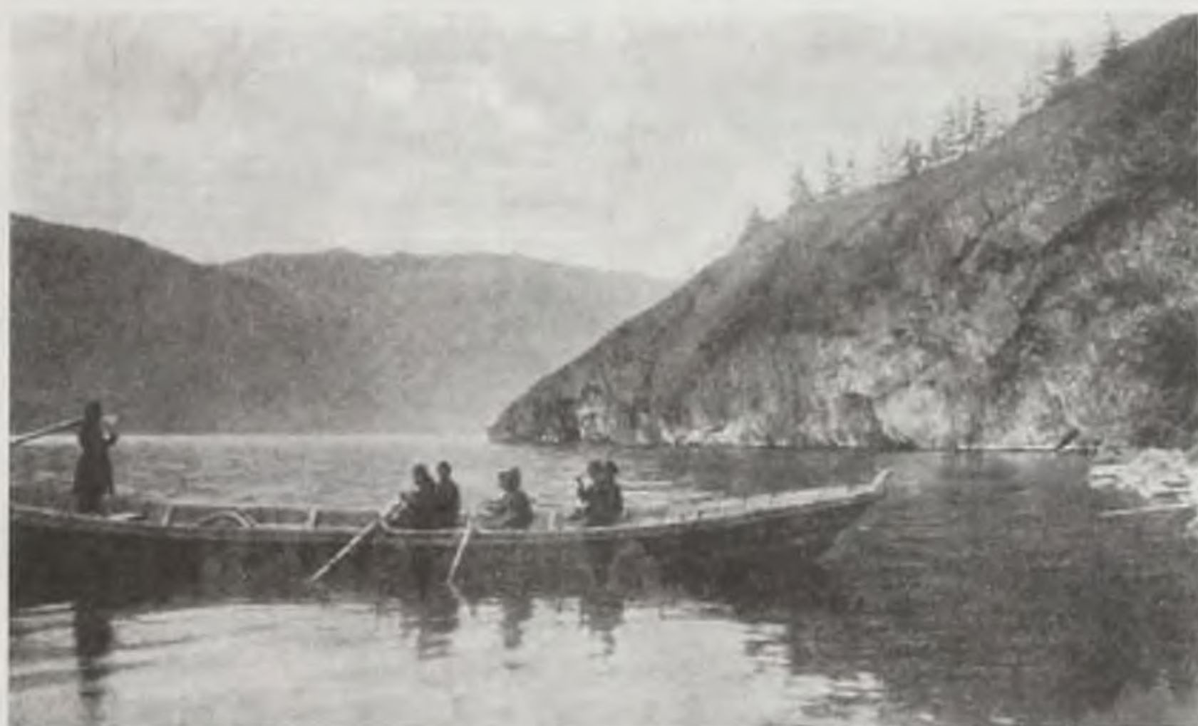
Рыбаки на Телецком озере. 1911 год. (Из фондов Томского областного краеведческого музея)