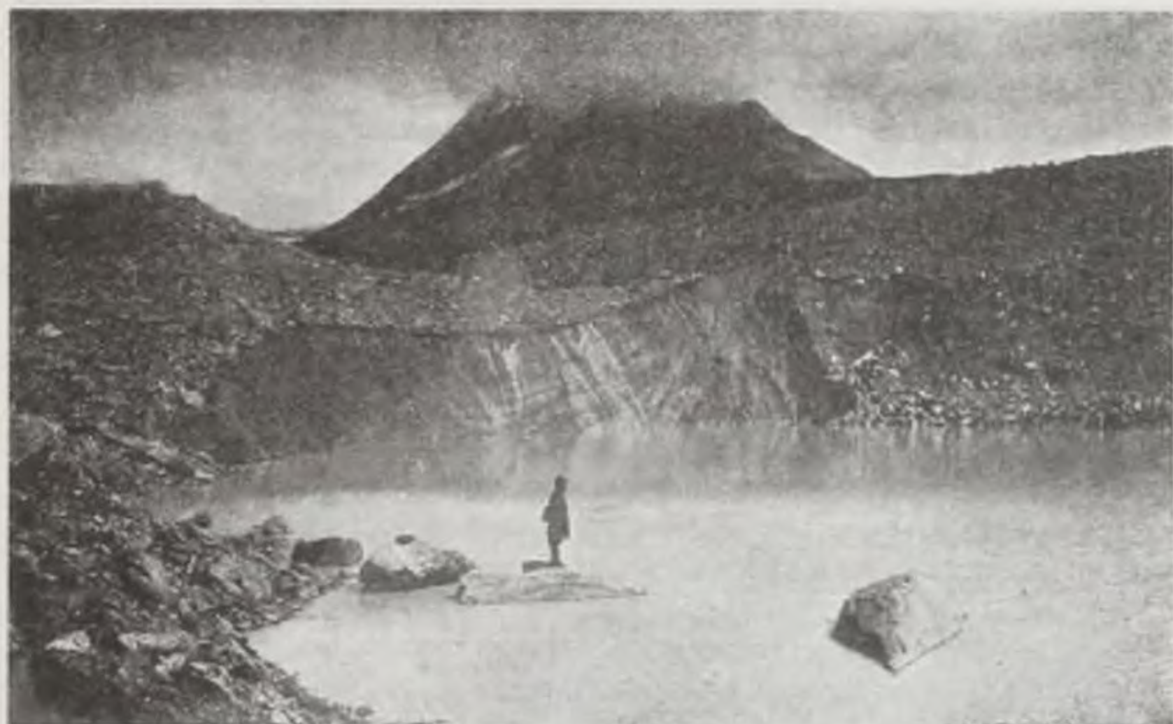
Высокогорное озеро Берельских ледников (склон горы Белухи)