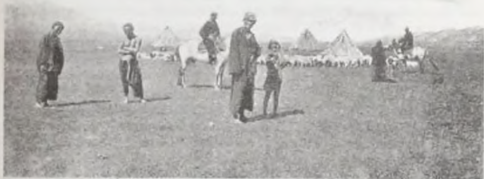
Жители Усть-Канской долины. Фотография начала XX века. (Из фондов Томского областного краеведческого музея)