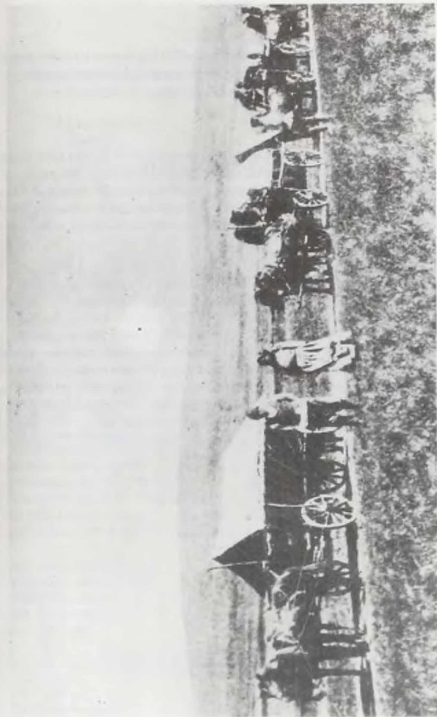
В поисках лучшей доли. Крестьяне-переселенцы из центральных губерний России на земле Горного Алтая. Конец XIX века.