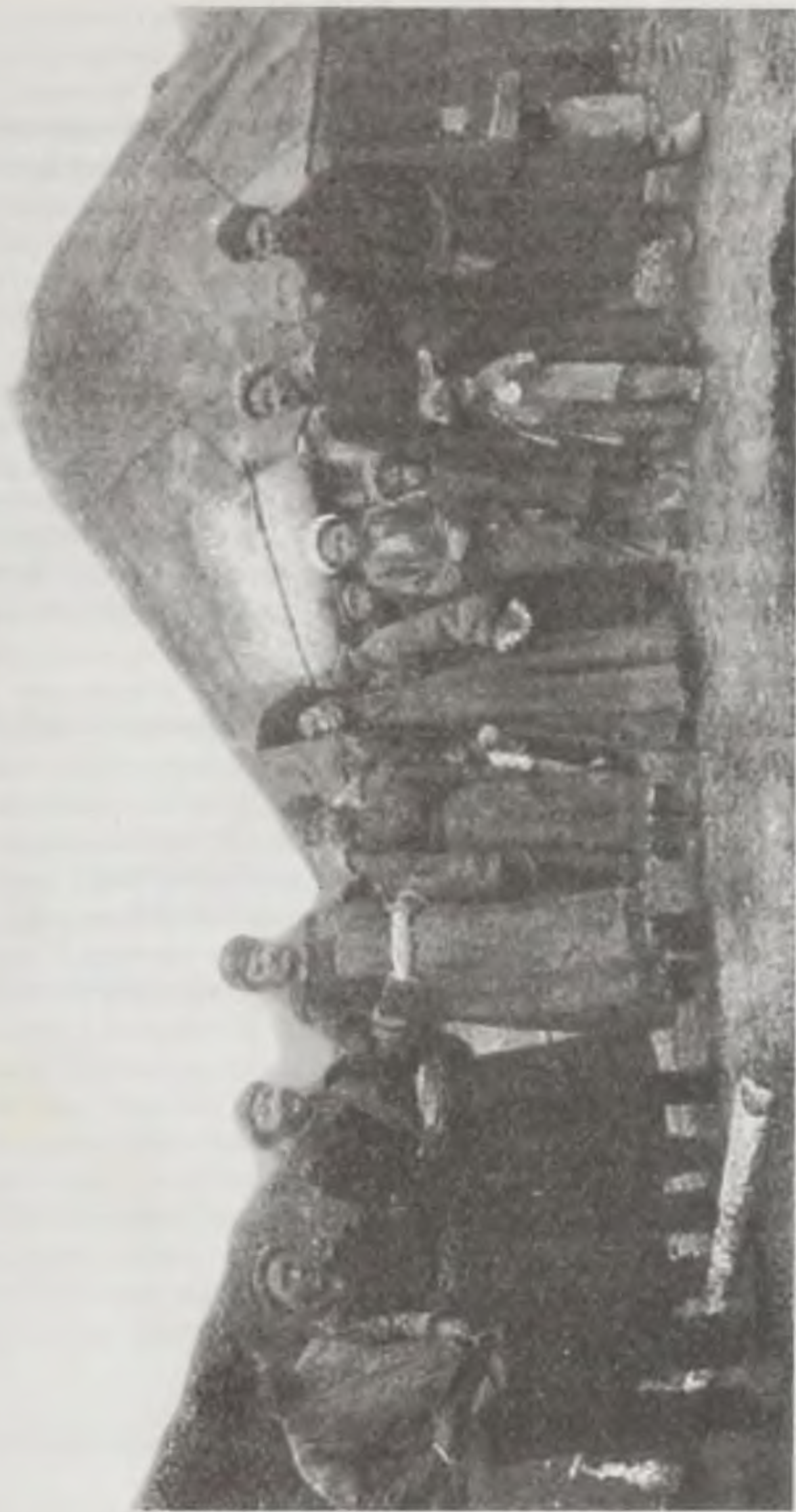
Алтайский зайсан с семьей. Верховья реки Каракол. 1911 год.