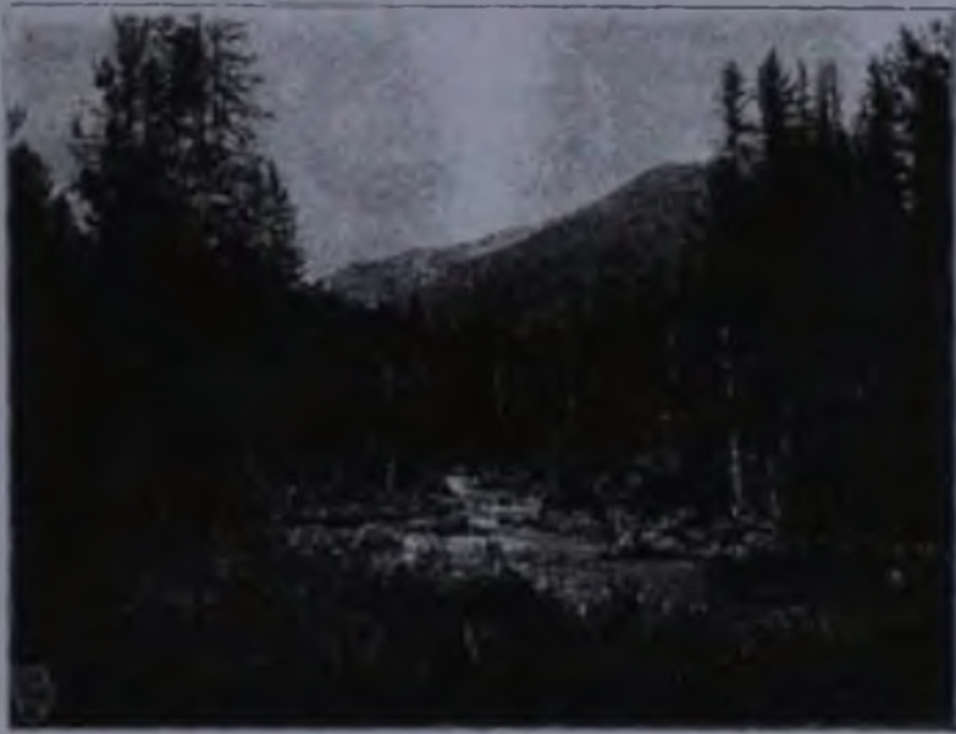
Видъ въ Алтай.

Мы были на сѣверномъ берегу Телецкого озера, верстахъ въ 4 отъ истока Бив. Послѣ мрачной черныи видъ этого альпійскаго озера, находящагося на высотѣ 473 метр. надъ моремъ, особенно поражаетъ дикою красотой своихъ береговъ. Синяя полоса воды, вправленная въ узорчатую темно-зеленую раму гористыхъ береговъ, постепенно расширяясь, уходитъ на востокъ и скрывается за крутымъ мысомъ, а на западѣ