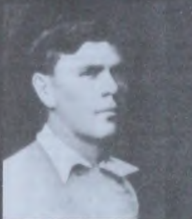
Булгаков Платон Родионович