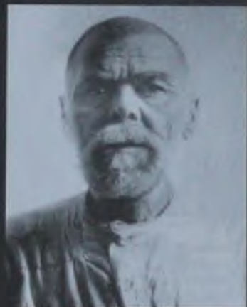
Волосский Василий Никитич