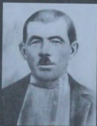
Шебалин Василий Александрович