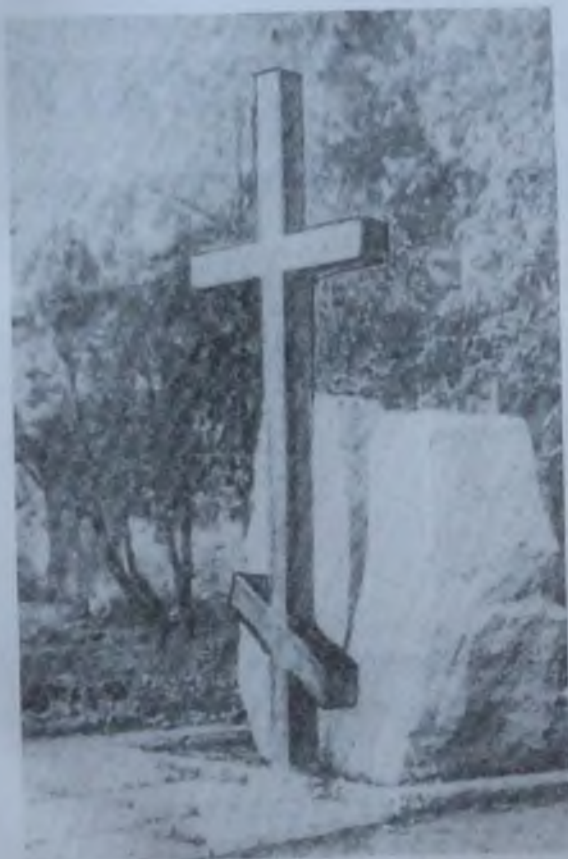
Памятник павшим в Сталинских репрессиях

КНИГА ПАМЯТИ ЖЕРТВ ПОЛИТИЧЕСКИХ РЕПРЕССИЙ