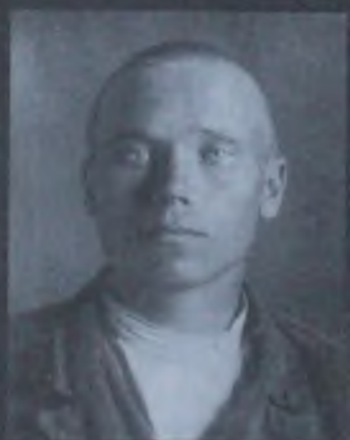
Пепеляев Исон Трифонович